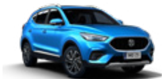
Cosmo Blue (metallic)