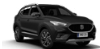
Pebble Black (metallic)