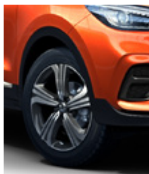
Jante 17" model Dinamic (motorizare 1.5)