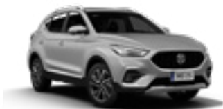
Monument Silver (metallic)