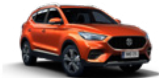
Hexton Orange (metallic)