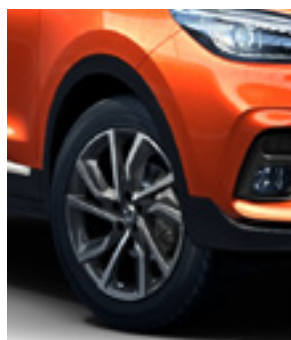
Jante 17" model Active (motorizare 1.0)