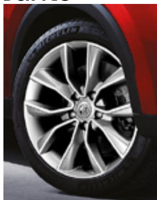
Jante aliaj 17"