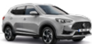
Medal Silver (metallic)