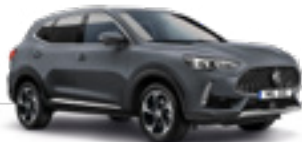
Magic Grey (metallic)