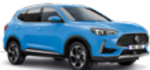
Brighton Blue (metallic)