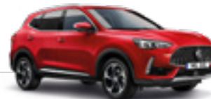
Diamond Red (metallic)