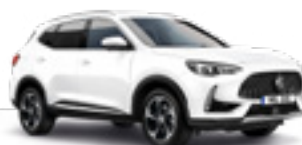
Dover White (non-metallic)