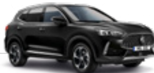
Pebble Black (metallic)